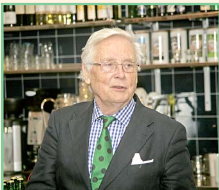
VSF berättar om den kommande Homandeckaren med avstamp i Tanzania