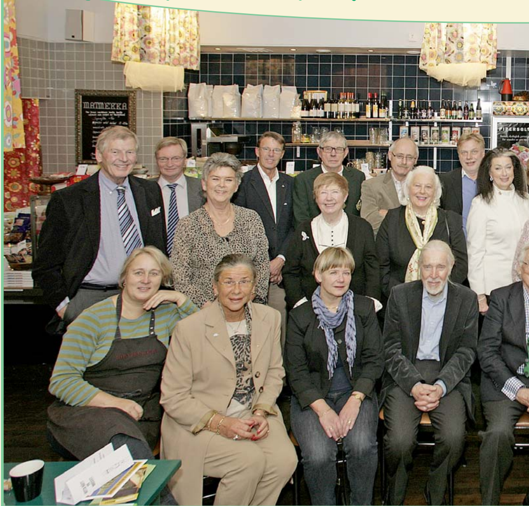
Hela det glada gänget som samlades minus ordföranden som höll i kameran