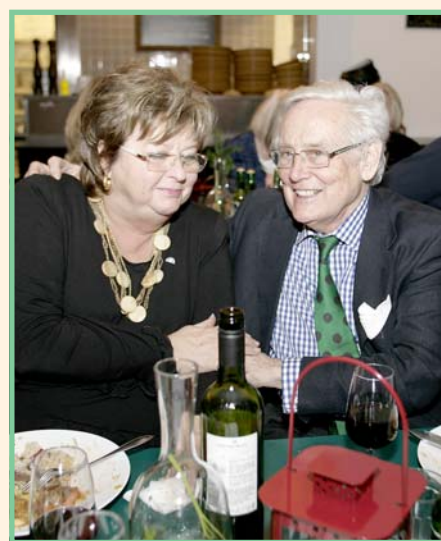
VSF berättar något bloddrypande ur sin rika fatatur