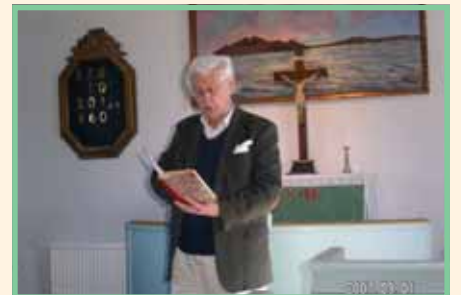
VSF ger oss en inblick i marinarkeologi i kapellet.

Rostbiff, lax, sallad och potatissallad stod på menyn. Vid förfrågan fö-