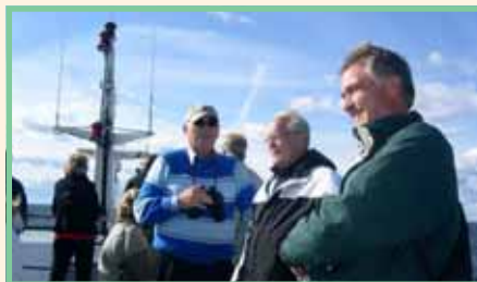
På väg mot Gunnarstenarna.

stift eftersom den inte ansågs vara tillräckligt kyrklig. Efter ett antal turer fick den dock hänga kvar som altartavla.