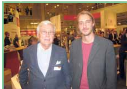
VSF med skådespelaren och debutförfattaren Jonas Karlsson.