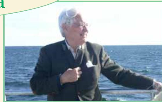
V.S.F njuter av sjöturen.