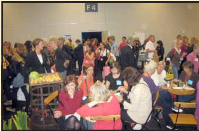
Bokmässan, sid. 6 & 7