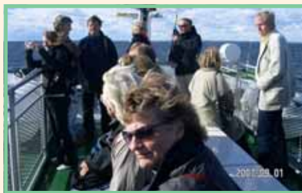
På väg mot Gunnarstenarna.