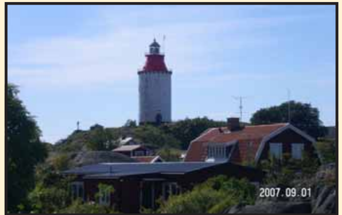
I Homans fotspår sid 7 & 8