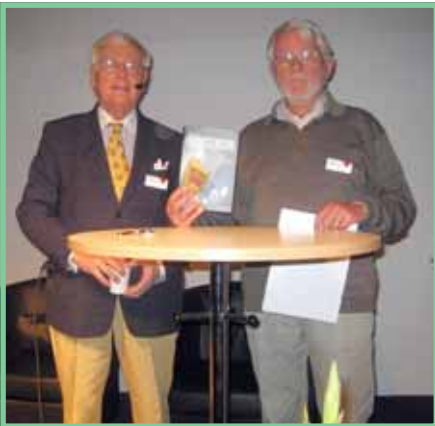
VSF talar ut med Deckarförbundets ordförande.

delar av Sverige, en del för att få se Kristi Brud, andra för att få sitta bredvid Akademiledamoten Kerstin Ekman.